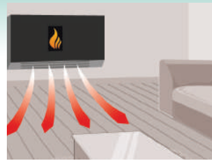
Distribuzione uniforme del calore Uniform heat distribution