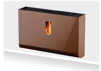
Prodotto da fissare al muro Product to be fixed to the wall