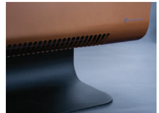
Piedistallo opzionale Optional pedestal