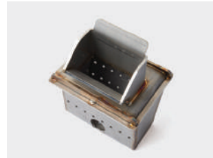
Braciere in acciaio inox 316L Stainless steel burning pot 316L