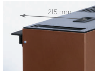
Spessore ridotto Reduced thickness