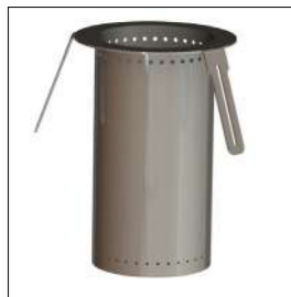
BRACIERE INOX 5 KG